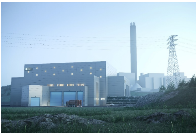
Figur 1: Illustrationsbild över planerad anläggning

Första spadtaget togs i februari 2022 och sedan dess har markarbeten pågått. I maj 2022 beräknas pålningen av ca 300 pålar vara slutförd och gjutning av betonggolv vara påbörjad.