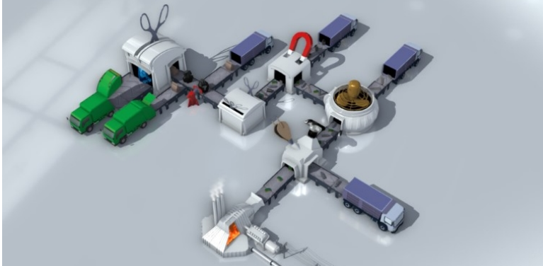
Figur 2: Översiktlig illustration över anläggningens funktioner

Projektet har fullt samordningsansvar för genomförandet och har därför satt samman en omfattande projektorganisation för att spegla ansvaret. Samtliga roller i projektet är i dagsläget tillsatta.