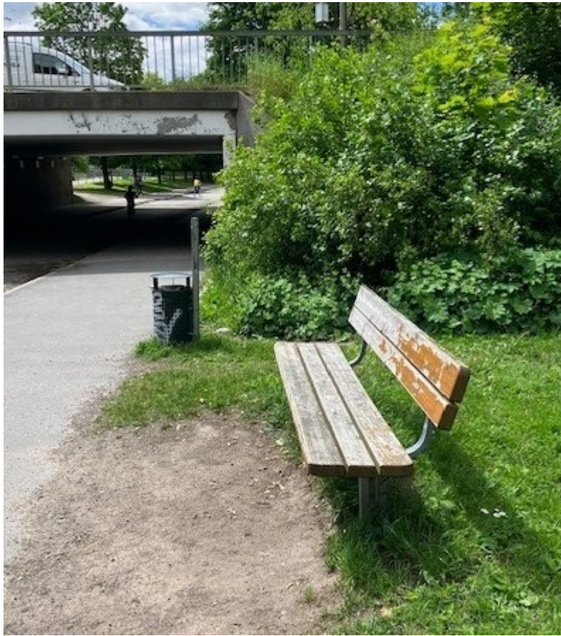
Bänk och skräpkorg vid Farstagången norr om Farstavägen

närheten. Ytterligare några meter upp mot centrum finns en träbänk som enligt Lindberg är illa underhållen.