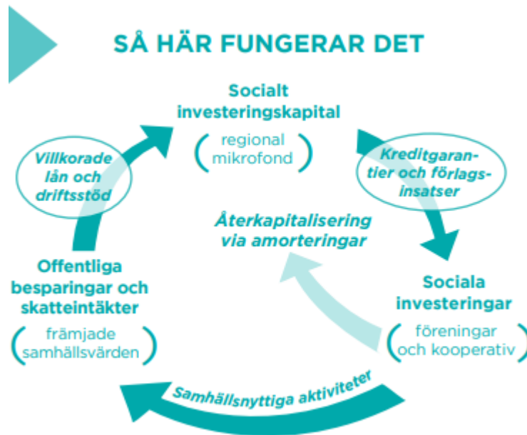
Figur 4 Mikrofonden - så fungerar det. Källa mikrofonden.se

Några kommuner har valt att göra investeringar i Mikrofonden.