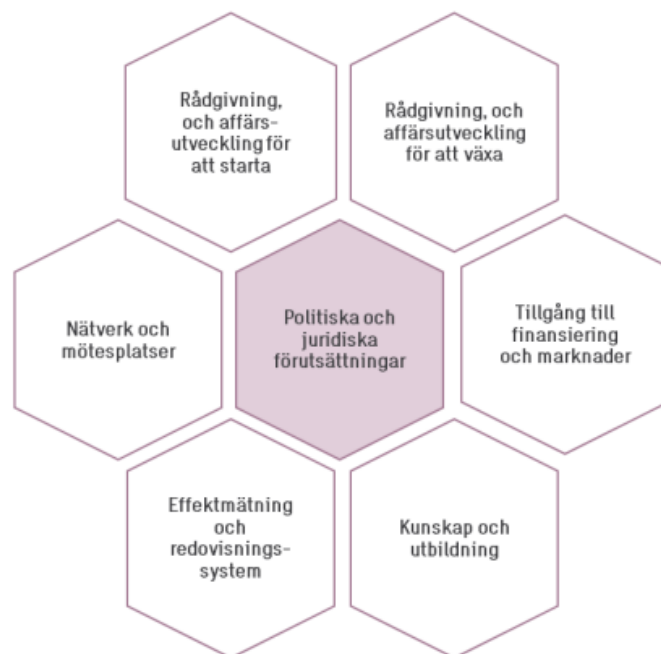
Figur 2 Ekosystem för socialt företagande. Tillväxtverket 2017.

Tillväxtverket kom 2017 med en rapport med titeln Vilse i stöddjungeln? . Rapporten har inte ASF i fokus, utan sociala entreprenörer generellt. För den som vill veta mer om hur stödsystemet (ibland används begreppet ekosystemet) för socialt inriktade aktörer ser ut i Sverige, kan denna rapport ge en bredare bild.