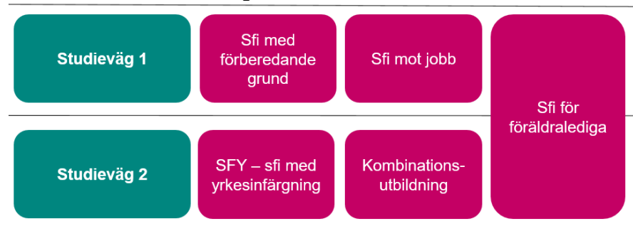
Bild 1. Sfi för olika studievägar

I Stockholm erbjuds undervisning i sfi på dagtid (förmiddag eller eftermiddag) mellan 15-18 timmar per vecka och kvällstid fem timmar uppdelat på två tillfällen. Det finns även vissa kurser på lördagar. Det finns olika typer av studiegrupper, vilka beskrivs mer ingående i kapitel 5. För studieväg 1 och 2 erbjuds endast klassrumsundervisning. Fjärr- och hybridundervisning erbjuds dock i olika omfattning under coronapandemin. För studieväg 1 och 2 finns också möjlighet att läsa sfi under föräldraledigheten tillsammans med andra föräldrar.