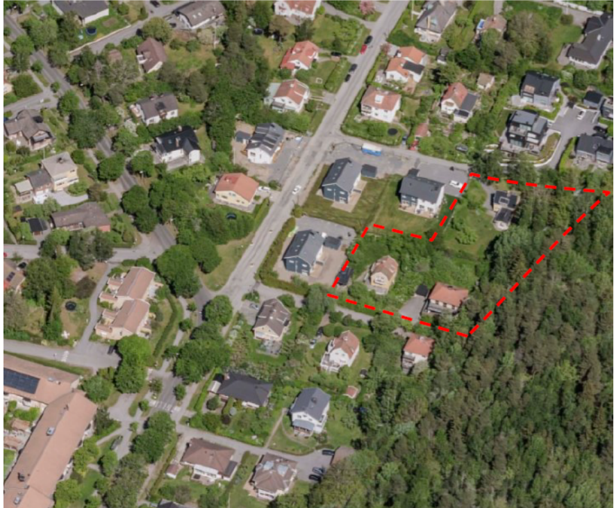
Snedbild från söder med planområdet markerat.

Planområdet omfattar tre villatomter som till större delen är planterade och där finns idag flera fruktträd, lövträd och buskar. Planområdet gränsar i öster till skogbevuxen naturmark.