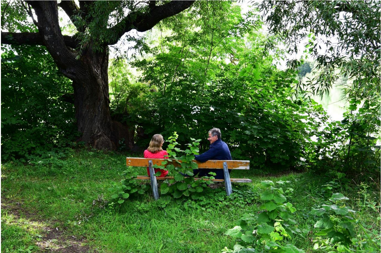
En till. Här skulle också själva parkbänken behöva få lite service.