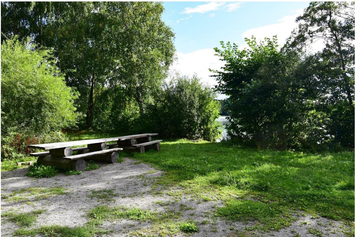
Också den fina grillplatsen växer igen.