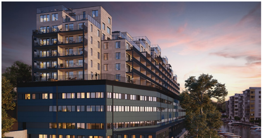
Illustration på förskolelokalen i bottenplanet. Bilden tagen från södra delen av fastigheten.