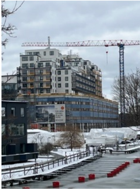
Bild från södra delen av fastigheten.