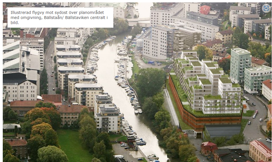
Bild från norr på Vandenberg 10 mot Ballsta bron.

Förvaltningen föreslår att stadsdelsnämnden inrättar en förskola med 4 avdelningar i kvarteret Vandenberg 10 i Annedal samt hemställer till fastighetsnämnden om förvärv av förskolelokalen.