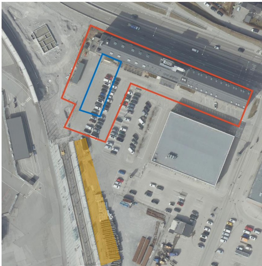
Figur 2. Ortofoto över projektområdet. Fastigheten är markerad i röd, tillbyggnaden i blå och området för där det tilltänkta torget är markerat i gult.

Förslaget innehåller tillbyggnad på befintlig bebyggelse med cirka 2 700 kvm BTA för en hotell- och restaurangdel med möjlighet till kontor. Förslaget innebär att det skapas möjlighet till cirka 60 nya arbetsplatser.