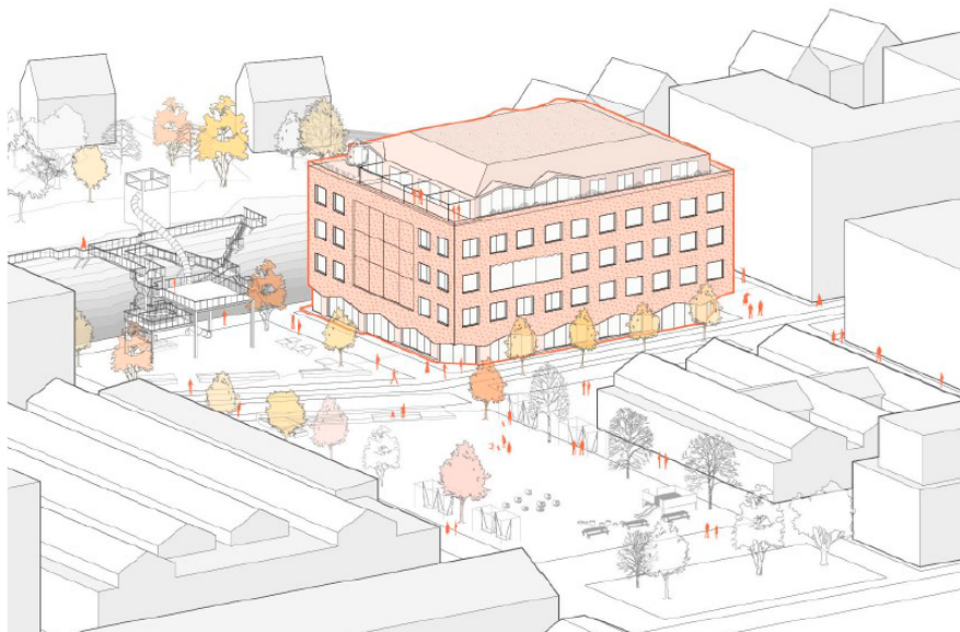
Figur: Illustration av ny skolbyggnaden sedd från sydost. I förgrunden syns den planerade nya parken Fållan och bakom skolbyggnaden skymtar bergsskärningen och befintlig villabebyggelse. Källa: samrådshandling detaljplan, diarienummer 2019-04267.