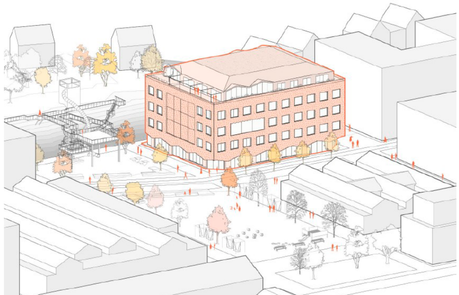
Figur: Illustration av ny skolbyggnaden sedd från sydost. I förgrunden syns den planerade nya parken Fållan och bakom skolbyggnaden skymtar bergsskärningen och befintlig villabebyggelse. Källa: samrådshandling detaljplan, diarienummer 2019-04267.