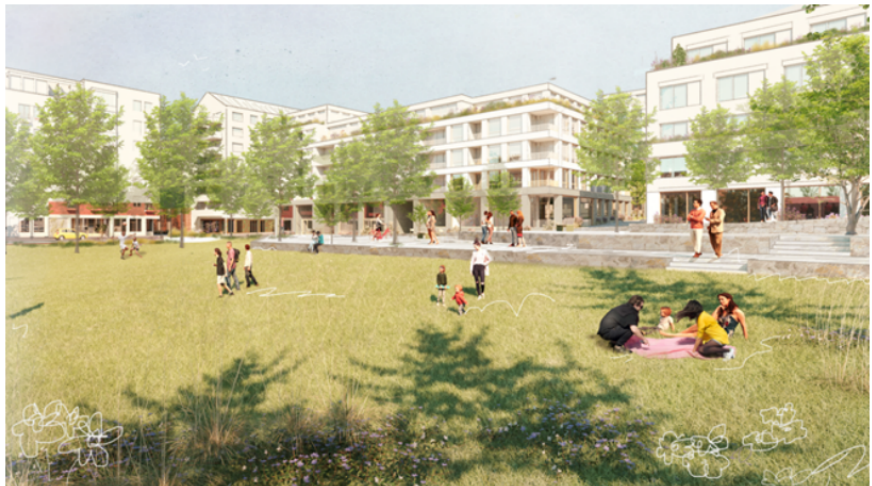
Bostadskvarteren G, A södra, B och C sett från Södra parken. Illustration: OKK+

Kvarter J: Här planeras för kontor med lokaler i bottenvåningen. Byggnaden för Enskede Elverk från tidigt 1900-tal bevaras med en tillbyggnad i fyra till sex våningar i en enkel och annorlunda stil som framhäver elverket.