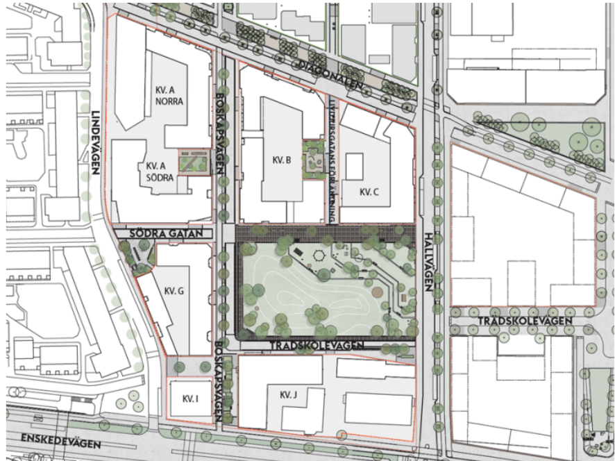
Illustrationsplan över de olika kvarteren i etapp 3, Nyréns

Kvarter A Södra: Planförslaget medger vård- och omsorgsboende med 100 platser samt ett seniorboende med 28 lägenheter. I bottenvåningen föreslås ett aktivitetscenter för boende samt besökare från närliggande stadsdelar som exempelvis Enskede Gård. Här föreslås även den rofyllda fickparken som öppnar upp mot kvartersmark på innergården.