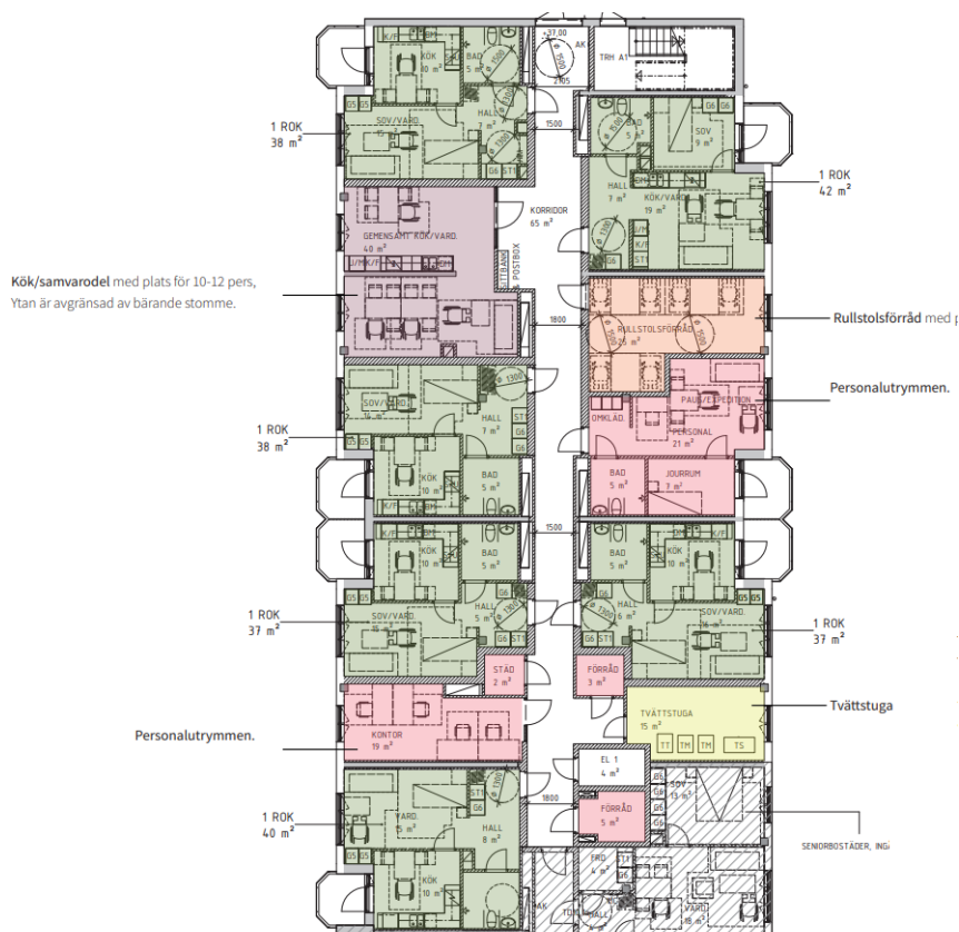
Bild: planritning gruppbostad LSS, Bersågränd 7.