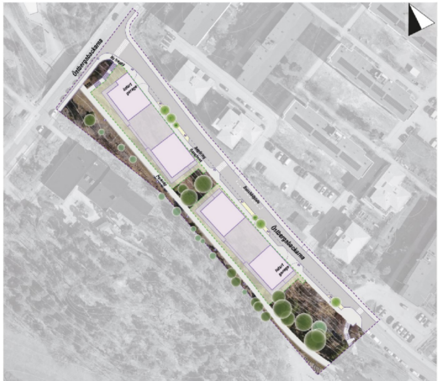
Bild 2. Bild från planförslaget som visar punkthusens placering och förhållande till befintlig parkväg.

Bostadsgårdar mellan punkthusen ligger på en högre nivå än Östbergabackarna och kommer kunna nås via trapphus.