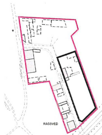
Bild 2. Kartbild Snösätra upplageområde

Enskede-Årsta-Vantör sdf arrenderar tre tomter om ca 6500 kvm, inringat med svart markering i bild 2 nedan. Det är också till dessa tre arrenden som Kulturplatsen har koncentrerats.