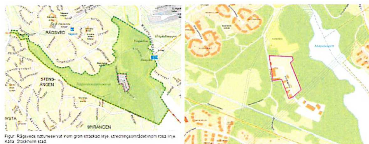
Bild 1 Kartbilder över Rågsveds naturreservat samt Snösätra upplageområde

Den södra delen av Snösätra revs under 2020 som en följd av beslutet att upprätta ett naturreservat. Norra Snösätra blev emellertid kvar och är fortsatt planlagt som upplageverksamhet.