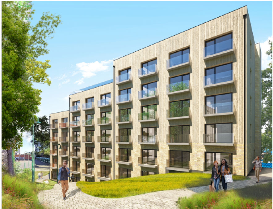
Bild 2. Byggnadens fasad mot parkvägen.

Byggnaden från planförslaget är två till tre våningar högre än närliggande lamellhus, men lägre än centrumbyggnaden vid Bandhagsplan. Enligt planförslaget förhåller sig byggnaden höjdmässigt till det nya bostadshuset som ligger strax norr om Bandhagens centrum, utmed Trollesundsvägen.