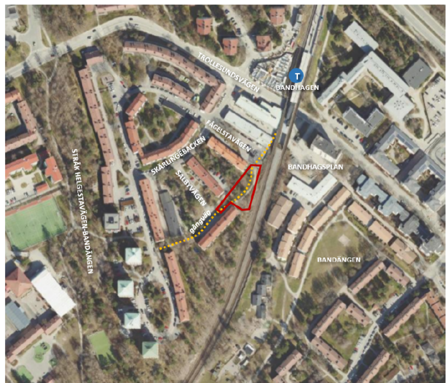
Bild 4. Befintlig parkväg markerad med streckad gul linje och planområdet markerat med rött. Källa Stadsbyggnadskontoret 2023.

Parkvägen som löper genom planområdet är del i kopplingen mellan Bandhagens centrum, Salbyvägen och Fågelstavägens norra och södra del. Kopplingen består av trappor på flera ställen, bland annat inom planområdet.