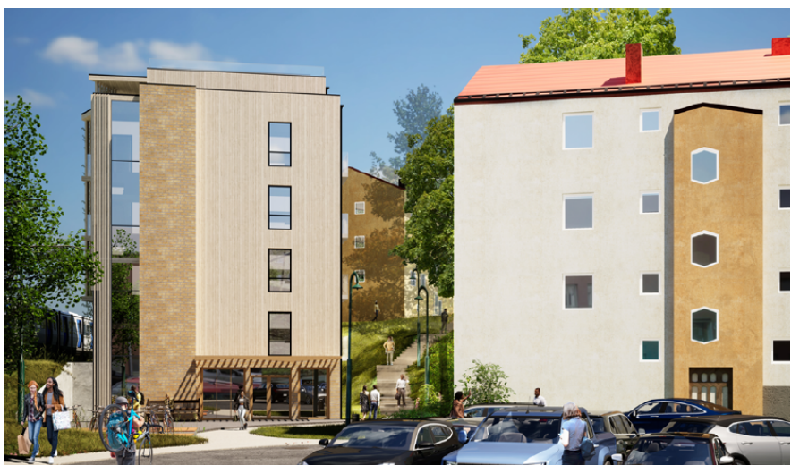
Bild 3. Skiss för byggnadens norra ände, där huvudentrén är.

Huvudentrén för byggnaden är placerad i den norra änden av huset, med en mindre entré i den södra änden. Planområdets närhet till tunnelbanespåret ställer en del krav på byggnaden kopplat till riskavstånd och buller, och detta påverkar både placering och utformning. Bland annat har huset loftgångar mot tunnelbanespåret och en tyst sida med sovrum mot parkstråket.