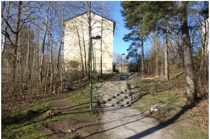
Bild 5. Den upptrampade stigen bredvid trapporna vid planområdet.

Om topografin och den begränsade ytan inte medger en korrekt utformad tillgänglig koppling, anser förvaltningen att det är bra om det i det fortsatta planarbetet går att utreda någon typ av enklare ramplösning för trapporna för att underlätta för barnvagnar och cyklar.