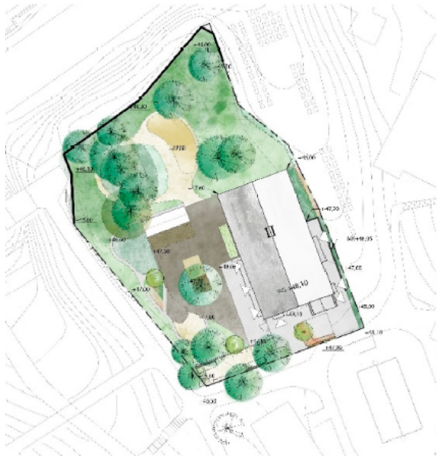
Bild 4. Situationsplan för den planerade förskolan.

Förskolegårdens totala friyta är 2 325 kvadratmeter, vilket motsvarar drygt 24 kvadratmeter per barn om varje avdelning har 16 barn. Friytan för befintlig förskola är cirka 1 500 kvadratmeter, vilket motsvarar strax under 23,5 kvadratmeter per barn. Ljudmiljön på förskolegården förbättras jämfört med idag, genom att bullerskärmar sätts upp mot tunnelbanan.