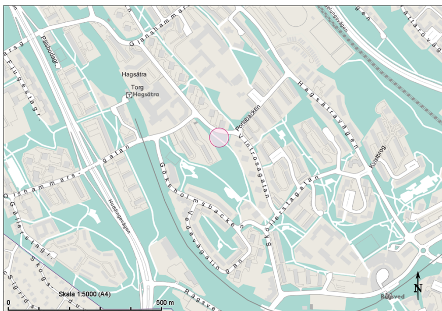
Bild 2. Ungefärlig placering av förskolan i Hagsätra.