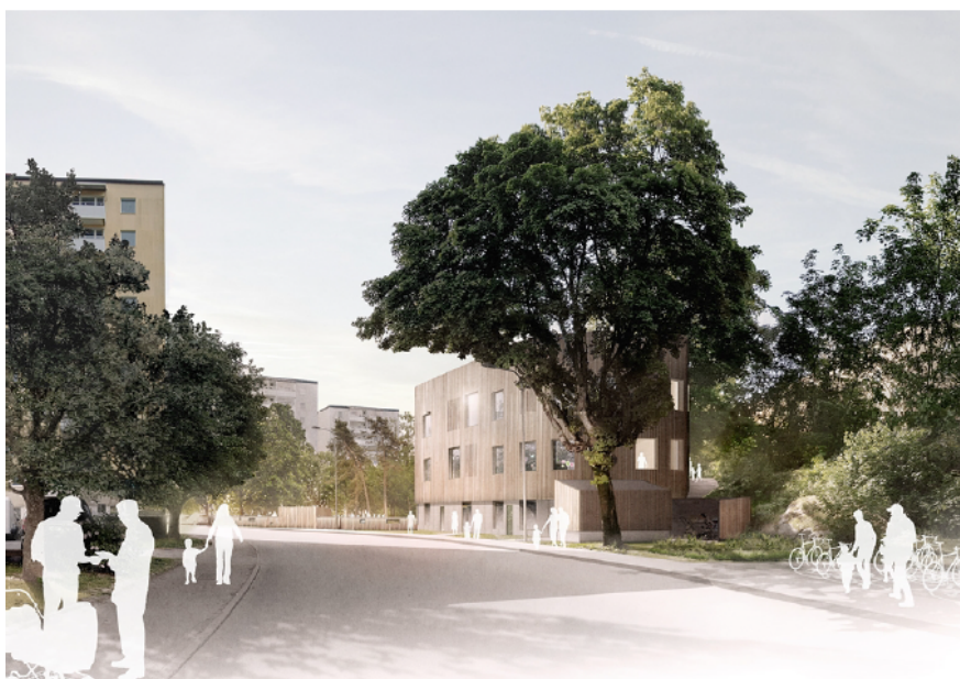
Bild 3. Visionsskiss som visar förskolan sedd från Vintrosagatan.

Förskolan från detta inriktningsärende planeras uppföras med tre våningsplan, varav en är suterrängvåning som anpassar byggnaden till topografin inom fastigheten. Fasaden på förskolan ska vara i trä och sockeln mot Vintrosagatan ska vara i betong eller likande stenmaterial.