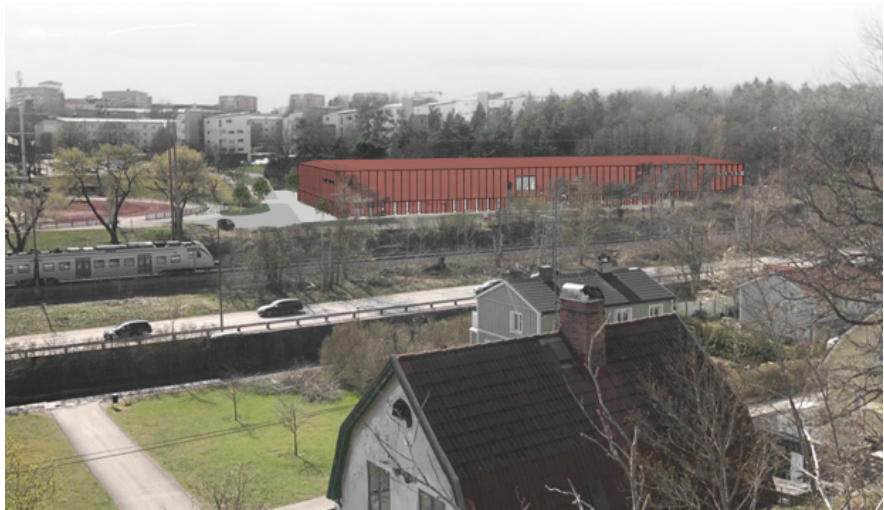
Bild 3. Visionsbild som visar hallens utformning i förhållande till sin omgivning, sedd från Örby.