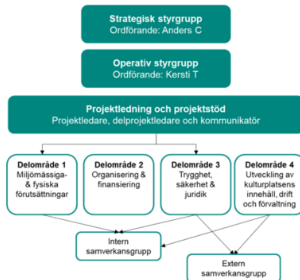
Figur 1. Projektets organisation

I projektets strategiska styrgrupp ingår representanter från de förvaltningar som fått uppdraget av kommunfullmäktige att samarbeta kring en etablering av kulturplatsen. Se tabell 1 nedan.