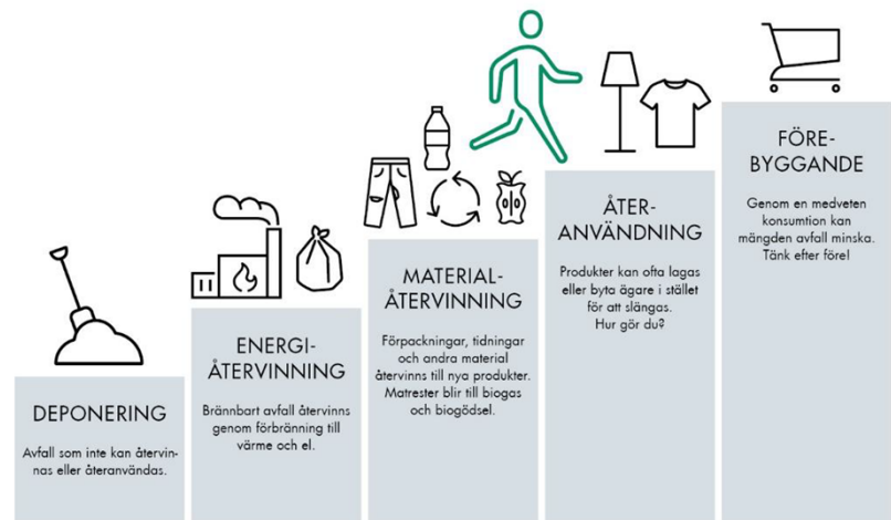
Figur 1. EUs avfallshierarki, avfallstrappan.