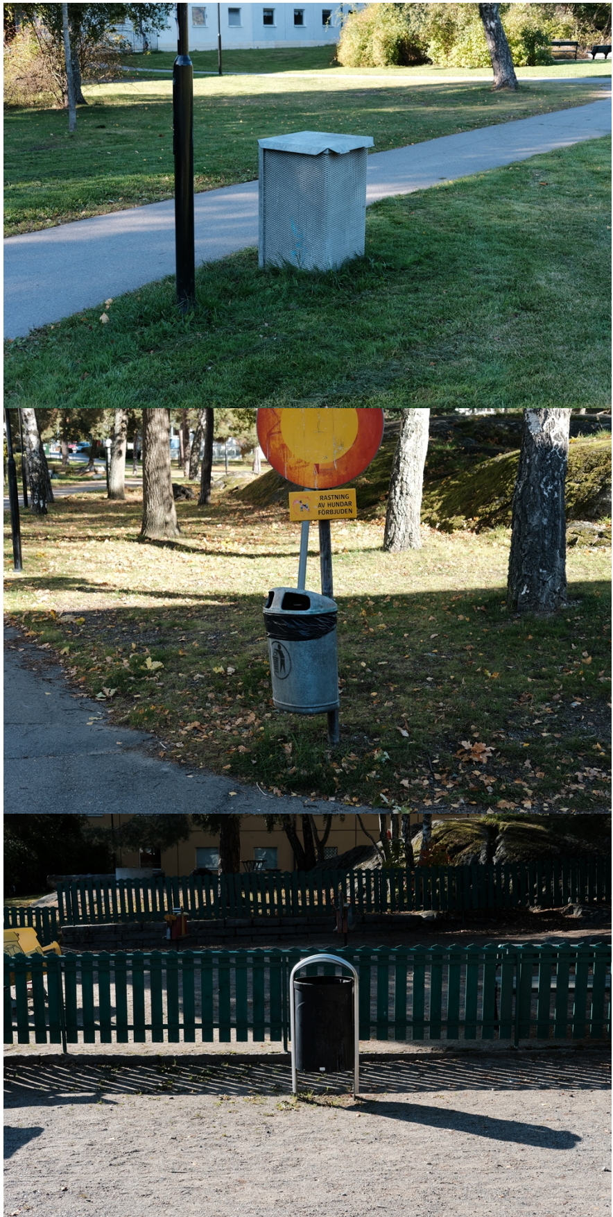
Bild 2. Urval av de olika typer av papperskorgar som finns i Stamparken