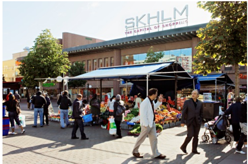
Exempel på tillfälliga aktiviteter: Skärholmen.