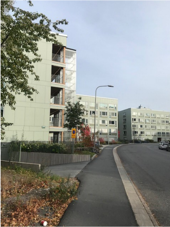
Vy från Bjursåtravägen