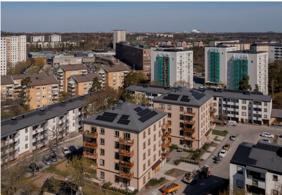
Drönarbild över Kilsgratan.