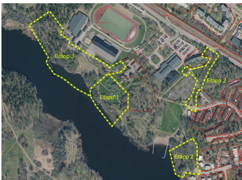
Etappindelning Farsta strandpark

Hösten 2018 tog förvaltningen fram ett förslag till program för hela parkområdet. Programmet fastställdes av nämnden vid sammanträdet den 7 mars 2019 med inriktningsbeslut att utveckla parken enligt programmet. Programmet finns att läsa här https://insynsverige.se/stockholm-farsta/protokoll?date=2019-03-07 Enligt beslutet ska arbetet utföras i etapper där parken nedanför Farsta gård är första etappen. Projektering inför etapp 1 har gjorts under våren 2019.