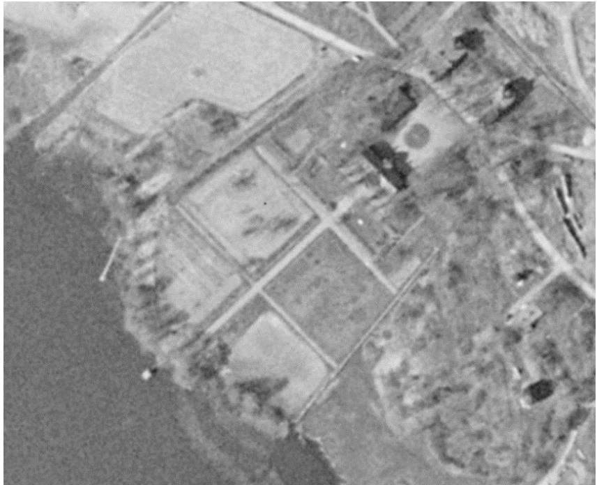
Flygfoto taget någon gång under tiden 1955–1967

Foton från 1970-talet visar att parken var i dåligt skick vilket troligtvis gjorde att man genomförde en upprustning på 1980-talet då parken fick sitt nuvarande utseende.