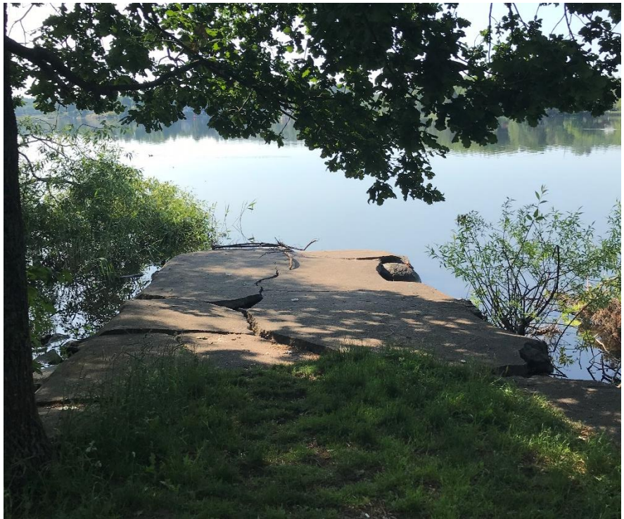
Den trasiga betongbryggan med utblick mot söder.

Siktluckan kompletteras med ett par parksoffor vid strandkanten så att även de som inte vill ge sig ut på bryggan kan njuta av den utökade vattenkontakten.