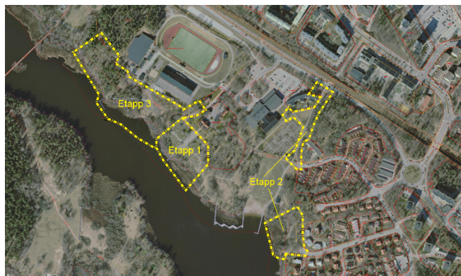
Etappindelning Farsta strandpark

Vid sammanträdet den 7 mars 2019 antog stadsdelsnämnden förvaltningens program för Farsta strandpark. I samband med detta fattade nämnden även inriktningsbeslut att utveckla parken i enlighet med programmet. Arbetet med parkens upprustning utförs i etapper där parken nedanför Farsta gård är första etappen.