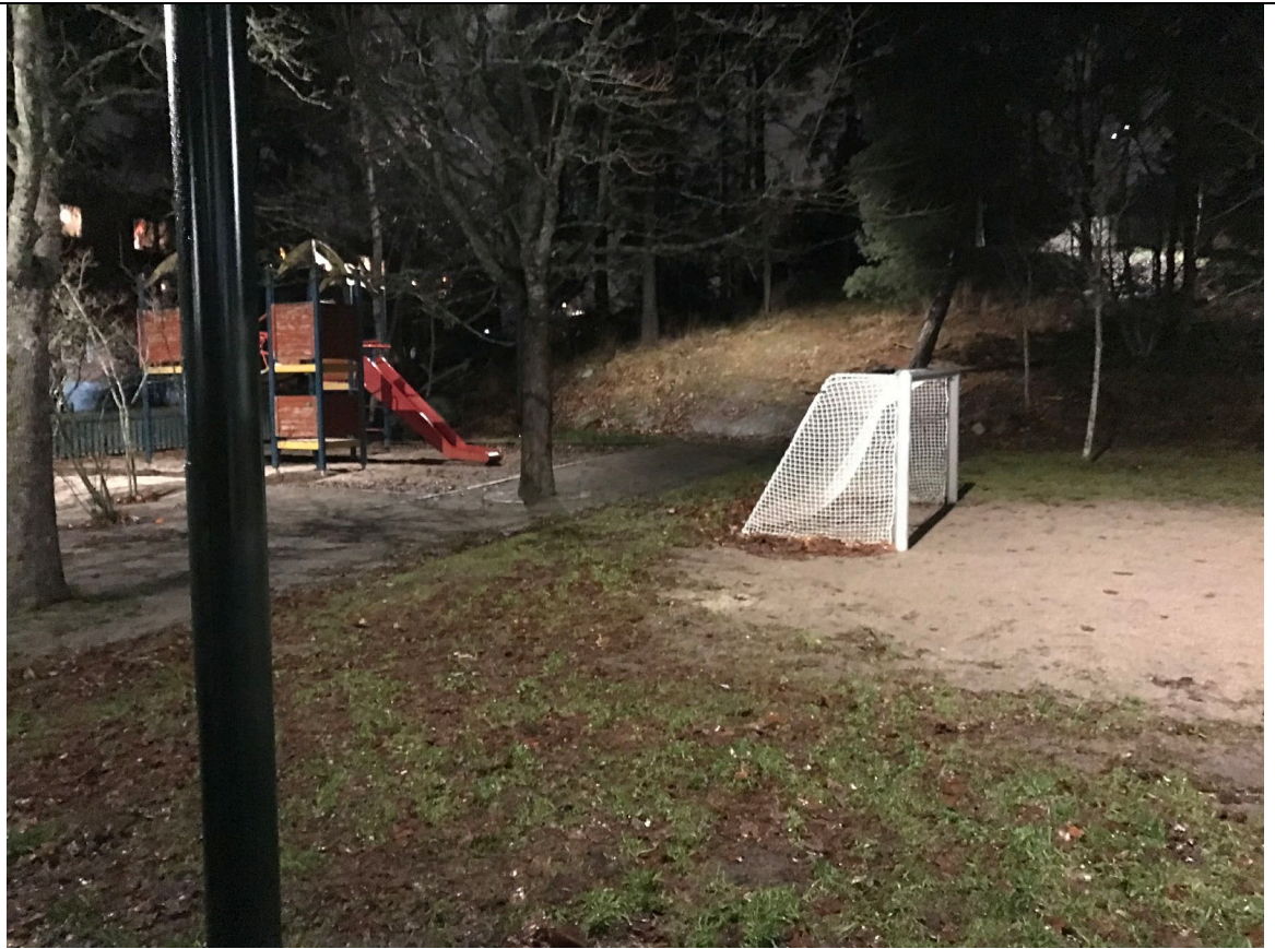
Semlan före 2: