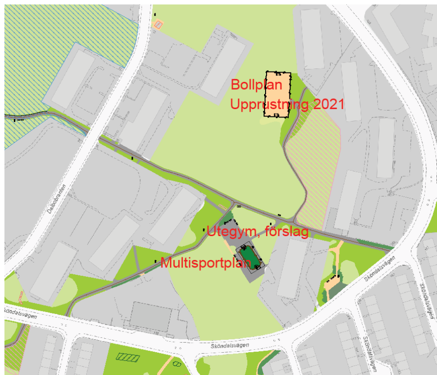
Naturmarksområdet mellan Sköndalsvägen och Dalbobranten

Förvaltningens alternativ är istället en plats cirka 100 meter söder om föreslagen bollplan. Där finns en multisportplan och en asfaltsyta med några bänkar och en uppmålad yta för bollspel. Förvaltningen tror att platsen lämpar sig väl för ett senioranpassat utegym. Förutom gymredskap föreslår förvaltningen att platsen kompletteras med ett par bord till befintliga bänkar. Eventuellt kan även en grill rymmas på platsen. Markbeläggningen byts ut mot grus eller annat genomsläppligt material.