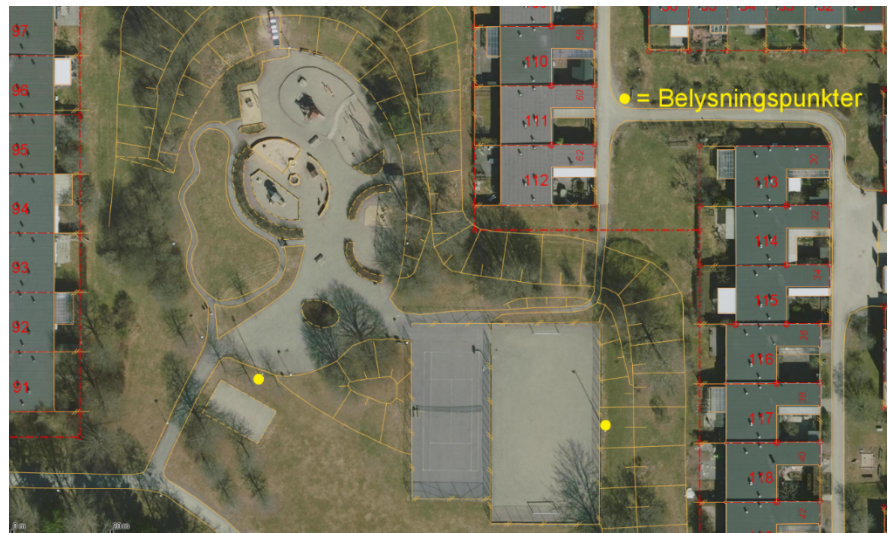
Belysningsmaster före åtgärd

idag räcker inte till för att lysa upp lekplatsens centrala del eller tennisbanan.