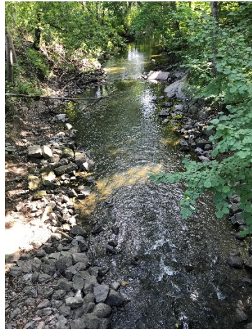
Gott om sten i Forsån