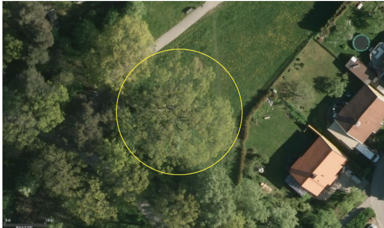
Referensbild av en annan ek i området 2015