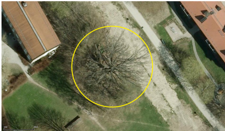
Flygfoto 2010 med spår efter schakt

Att trädet snabbt tappat sin vitalitet beror troligtvis på att schakt utförts i trädets rotzon. En annan trolig orsak är förändring av grundvattenförhållanden till följd av schakterna. Bilderna nedan visar hur trädets vitalitet har förändrats från 2006 fram till i år.