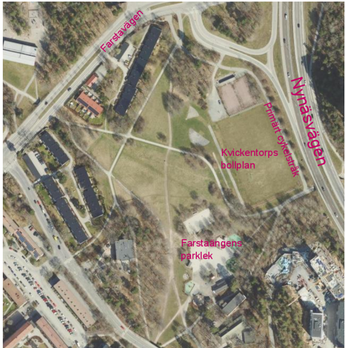
Flygfoto över den mest bullerutsatta delen av Farstaängen

Projektet att upprusta och utveckla Farstaängen till en aktivitetspark har pågått sedan 2018 då ett program för hela parken togs fram. Programmet fastställdes av stadsdelsnämnden den 23 maj 2019. Projektet genomförs i etapper. Hittills har etapp 1 avslutats och etapp 2 och 3 pågår nu i olika stadier. Den största och sista etappen som omfattar den mest bullerutsatta delen är ännu inte påbörjad.