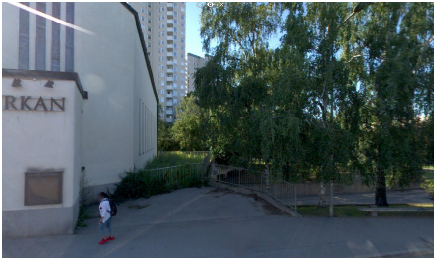
Den avstängda passagen över lastfaret längs med Centrumkyrkan, sedd från Kroppaplan.

Under tunnelbanebroarna kan gräset inte växa på grund av torka, vilket bidrar till att platsen upplevs som sliten och ful. Förutom en fantastisk vårblooming i naturmarksslätten bjuder platsen inte på mycket skönhet i dagsläget.