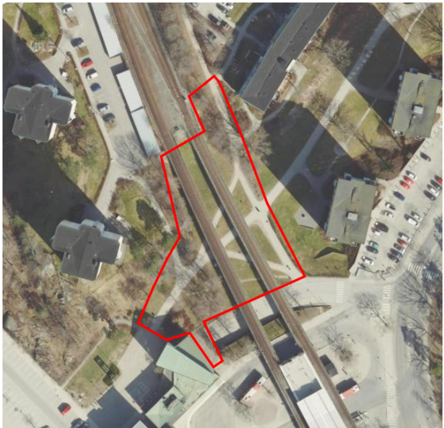
Entrén från Farsta centrum, projektområdet markerat med röd linje. Centrumkyrkan och Kroppaplan syns längst ner i bilden.

Under tunnelbanebroarna kan gräset inte växa på grund av torka, vilket bidrar till att platsen upplevs som sliten och ful. Förutom en fantastisk vårblooming i naturmarksslätten bjuder platsen inte på mycket skönhet i dagsläget.