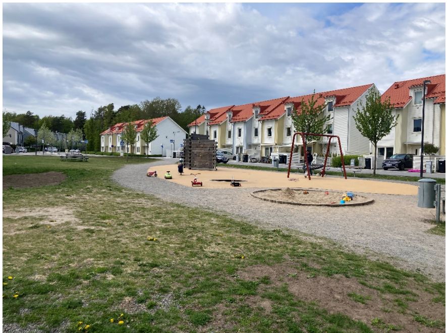
Bild som visar lekplatsen Byängen idag.