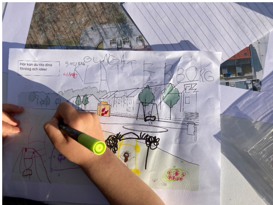
Bild från dialogmötet.

Samtliga synpunkter från dialogmötet har sammanställts och återkopplats till deltagarna. Dessa synpunkter har använts som underlag när förvaltningen tagit fram ett förslag för lekparken. Nya gungor, klätterlek och ny växtlighet är inslag som är planerade i utvecklingen av platsen.