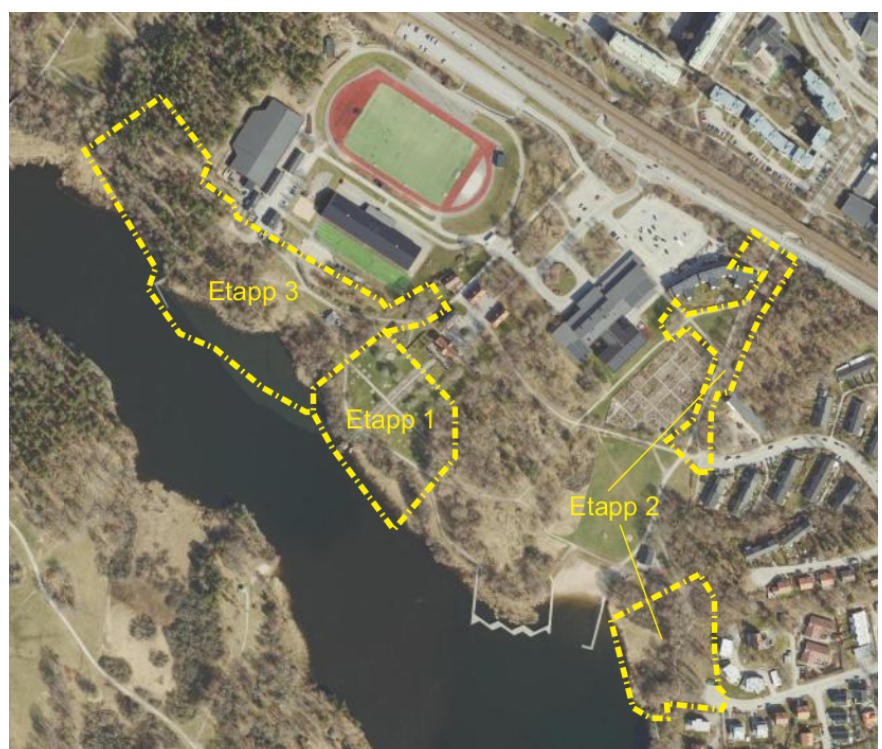
Etappindelning Farsta strandpark

Stadsdelsparker ska vara minst 5 hektar och innehålla stora öppna ytor och uppvuxna träd. De ska även ha ett rikt utbud både vad det gäller blomsterprakt, ytor för lek, picknick och spontanidrott. Platsen är vald för att den har många besökare och att den är relativt skyddad från buller. Delar av parken omnämns i Stockholms guide för tysta platser.