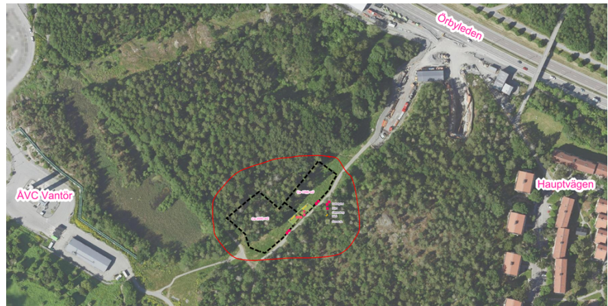
Bild 1. Kartvy som visar placering av hundrastgård

Farsta stadsdelsförvaltning avser att bygga en ny hundrastgård i Hökarängen under 2024. Nämnden har sökt och blivit beviljad trygghetsinvesteringsmedel om en miljon kronor för åtgärden. Förslagen placering är längs med gångvägen som går genom ”Norra Fagersjöskogen”, se bild 1 och 2.