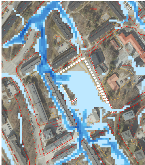
Figur 2. Figuren visar grafik från Miljöförvaltningens skyfallsmodell, där blå projektgrafik visar flödesvägar. Ju mörkare färg desto högre flöde. Vit streckad linje utgör projektområdet.

Tre dialogtillfällen har genomförts under arbetet med projekteringen av parken. Den första med skolbarn på friskolan Hästen under 2020 i syfte att få förståelse om barnens behov av platsen. Under 2023 skapades en fokusgrupp tillsammans med ferieungdomar, i syfte att prata om platsen. I februari 2024 anordnade stadsdelsförvaltningen en workshop där boende i området medverkade. Samtliga synpunkter har sammanställts och använts som underlag i projekteringen.