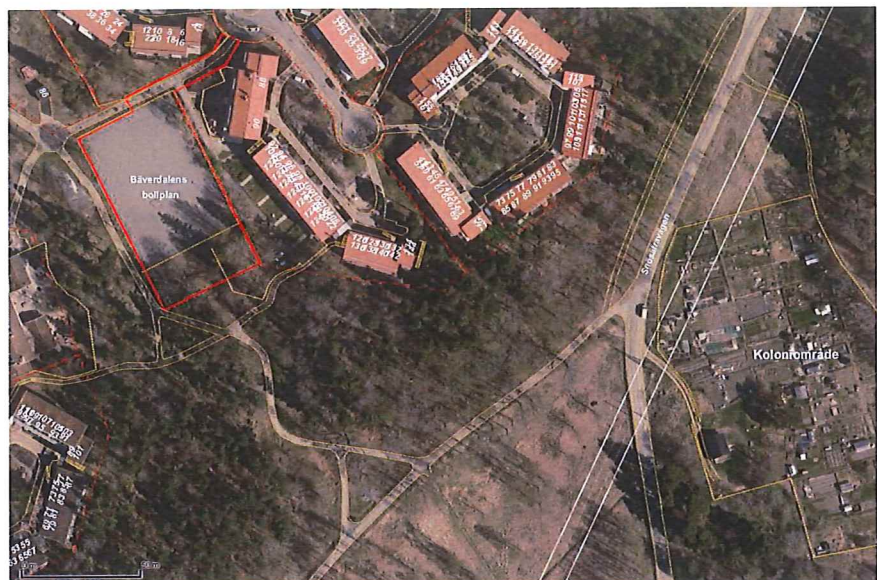
Bilden visar Bäverdalen BP till vänster och Snösättra kolonier till höger.

I stadens budget för 2018 går att läsa att alla barn oavsett bakgrund och förutsättningar ska kunna ha möjlighet att idrotta och alla ska kunna känna sig trygga i stadens idrottsanläggningar. Alla som besöker idrottsevenemang eller motionerar och idrottar i Stockholm ska göra det utan risk att bli utsatta för våld och utan att behöva uppleva otrygga miljöer.