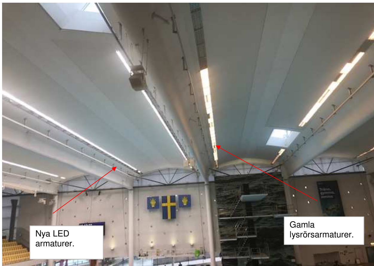
V1. Byte av belysningsarmaturer före och efter bytet.