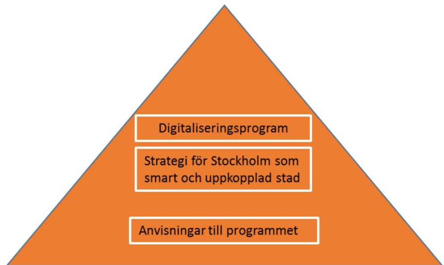
Figur 1: Digitaliseringsprogrammet är ett styrdokument med internt fokus. Strategi för Stockholm som smart och uppkopplad stad detaljerar målbilden och lägger grunden för genomförandet av stadens första stora initiativ som rör sakernas internet och användningen av stora datamängder. Anvisningarna förtydligar programmets innehåll och ger vägledning i hur programmet ska realiserars.

digitalisering och vidareutveckla den smarta staden. Strategin antar ett bredare perspektiv och involverar flera aktörer i regionen och ger tillsammans med digitaliseringsprogrammet en heltäckande beskrivning av stadens ambitioner och mål på digitaliseringsområdet.