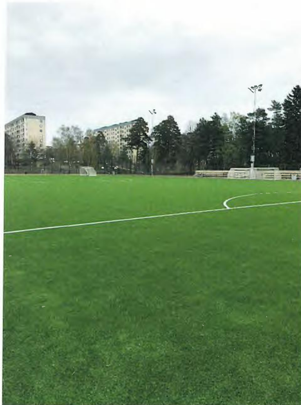
Bredängs BP inklusive gradängläktare.