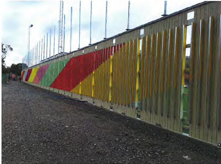
Detalj av konstverk Multi Matrix av Edith Lundebrække.

Projektet har omfattats av den så kallade 1 %-regeln. Ett kombinerat bullerplank och konstverk har i samarbete med Stockholm konst uppförts längs med Älvsjövägen. Konstnärerna Edith Lundebrække har skapat verket Multi Matrix.