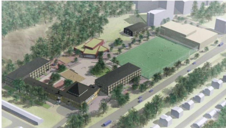
Illustration av Kämpetorpshallarna med konstgräsplan. I förgrunden syns Kämpetorpsskolan.