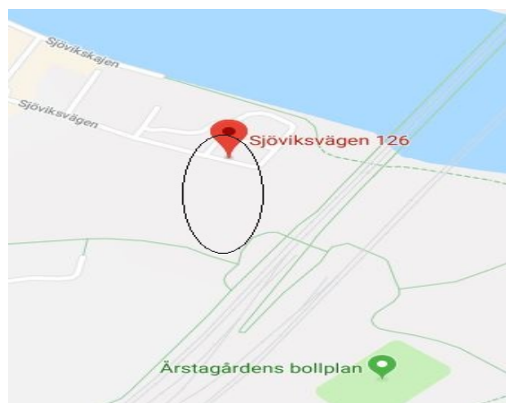
Kartbild hämtad från Eniro som visar platsen för bergtrummet.

Utredningarna visade att kontorets förslag på bergtrum i Liljeholmen, som då ägdes av ett byggbolag, var det bästa alternativet. En arbetsgrupp bildades med uppdrag att närmare utreda alternativet med bergtrum. Arbetsgruppen påbörjade under våren 2014 förhandlingar med byggbolaget.