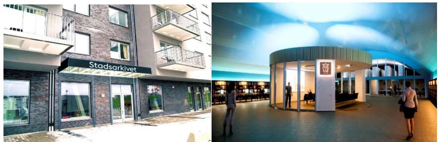
Exteriör- och interiörbild hämtad från A-systemhandling.

I genomförandebeslutet uppskattades investeringsutgiften för anpassning av bergtrummet och lokalen uppgå till cirka 72 miljoner kronor. Med 2017 års räntesats beräknades hyran enligt självkostnadsbaserad modell till cirka 7 miljoner kronor år 1.