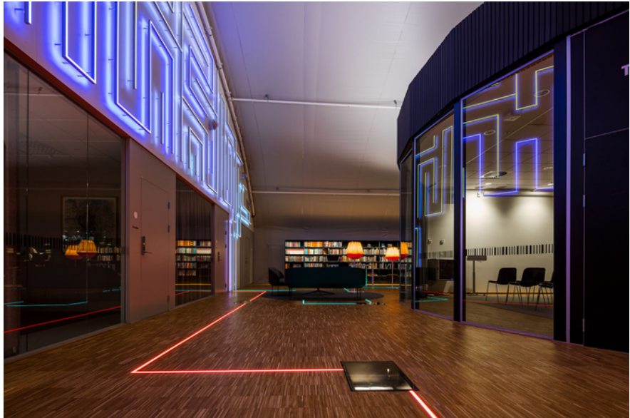
Konstverket Fantomgrottan av Ellen Ruge.

Stadsarkivets lokaler på Liljeholmskajen förenar möjligheten att förvara stora mängder arkiv med möjligheten att kunna erbjuda en spännande publik verksamhet med speciellt fokus på bebyggelsehistoria.