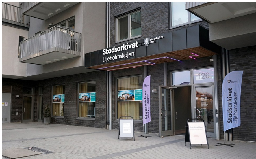
Entrén till Stadsarkivet Liljeholmskajen.

Lokalerna är på cirka 6 500 m 2 och rymmer både arkivmagasin och publika ytor där man kan forska, ta del av föredrag, utställningar och mycket annat. Verksamheten är inrymd i två berggrum som går 150 meter in i berget. Med de nya lokalerna framtidssäkras stadens och de regionala statliga myndigheternas behov av arkivleveranser.