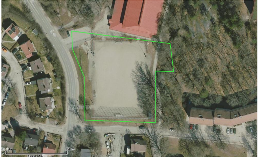
Bilden visar Sköndals BP och del av Sköndalshallen i överkant.

prognostiserad befolkningsutveckling inom staden. Skolor och föreningar i området har vid ett flertal tillfällen uppvaktat staden med önskemål om att utveckla bollplanen för stadsdelens barn och ungdomar.