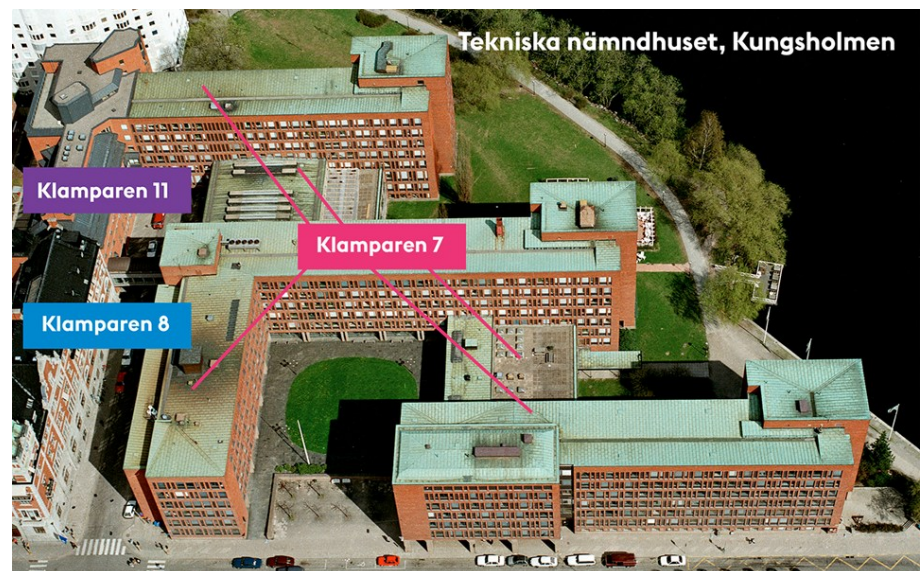
Tekniska nämndhusets olika fastigheter.

Tekniska nämndhuset, Klamparen 7, invigdes 1965 som arbetsplats för de tekniska förvaltningarna. Inga större renoveringar eller moderniseringar har gjorts sedan dess. 2016 beslutades att de tekniska förvaltningarna fortsatt ska vara samlokaliserade till Tekniska nämndhuset på Kungsholmen. Kommunfullmäktige beslutade i maj 2018 om ett genomförandebeslut för upprustning och modernisering av Tekniska nämndhuset. Ombyggnationen innebär också att fastigheterna Klamparen 8 (Separatorhuset), Klamparen 11 (hus 9) och Pilträdet 12 (Kanalhuset) kan friställas och nyttjas för andra ändamål.