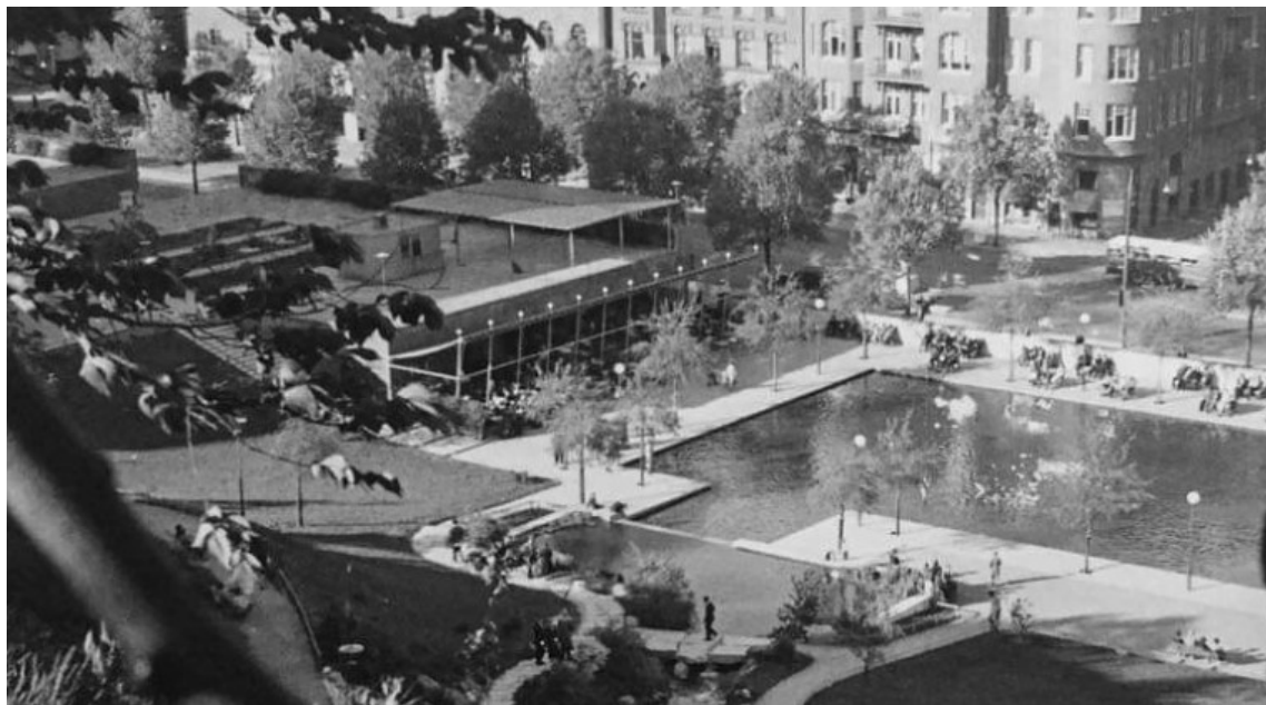
Historisk bild sett från Observatorielunden, troligtvis tagen kring 1945