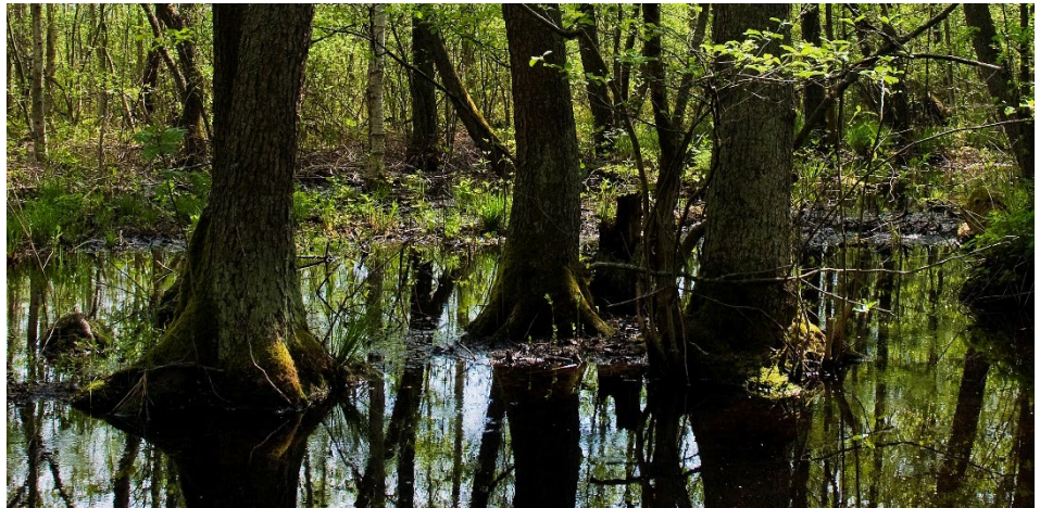
Fuktlövskog som omger Kyrksjön.

→ För mer information om avgränsningar och beräkning av kostnader, se referens: Underlag till lokalt åtgärdsprogram för Kyrksjön