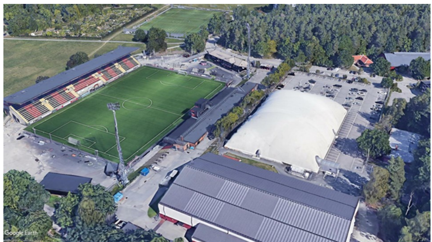
Bilden visar Grimsta IP, ishallen längst ner i bild.

Ombyggnaden är nödvändig för att långsiktigt kunna uppfylla verksamhetens behov.