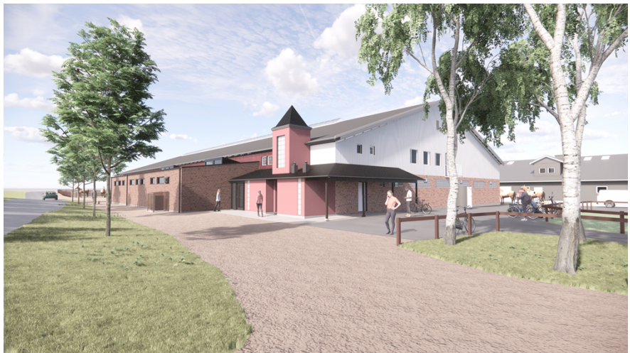
Illustration, tillbyggnad i tegel till vänster på bilden.

Vissa mindre markåtgärder runt tillbyggnaden planeras för att klara dagvattenhanteringen och tillgängligheten.